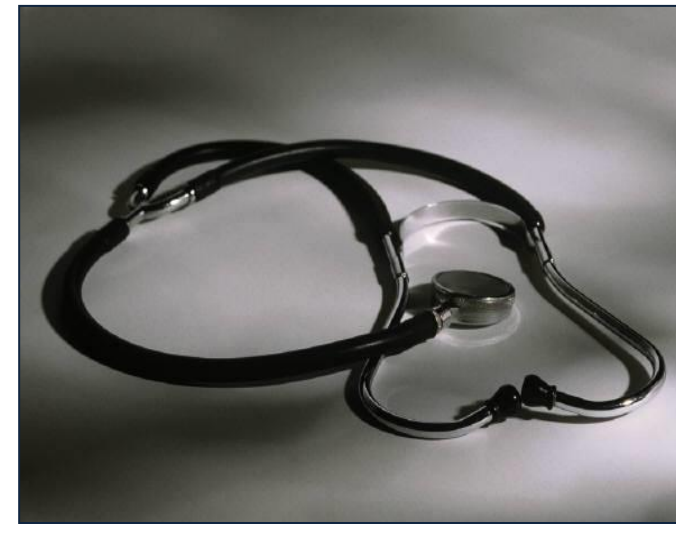
Şekil 1. Şekil adı ortalı olarak yazılacak.

Projeye ait sonuç bölümünü yazınız ve çıktıları gösteriniz.