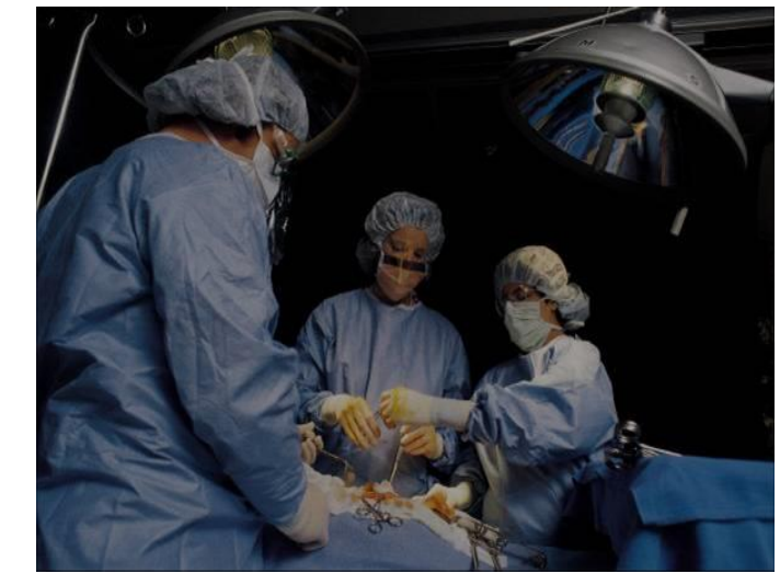
Şekil 2. 24pt Calibri.