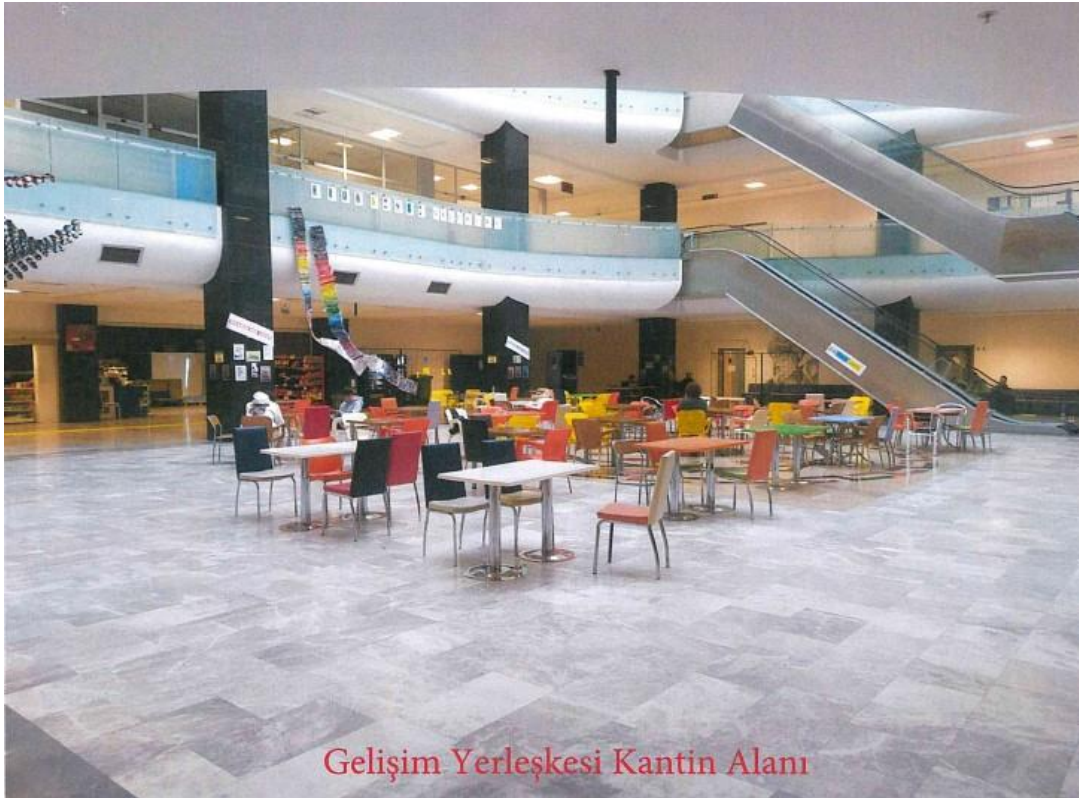
Gelişim Yerleşkesi Kantin Alanı